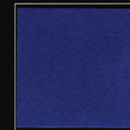
Bleu Louvre 263