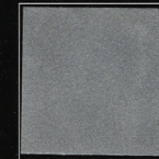
Gris Eiffel 258