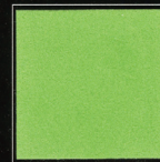
Vert Vendôme 261