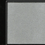
Gris Elysées 259