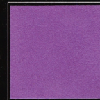
Mauve Saint-Germain 256