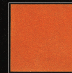
Orange Roland-Garros 253