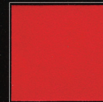
Moulin Rouge 255