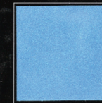
Bleu Georges V 265