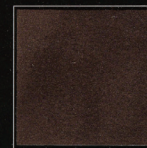
Marron Monceau 250

LuxeSkin c'est aussi le premier produit en microfibres à destination du packaging, de la reliure et de la décoration.