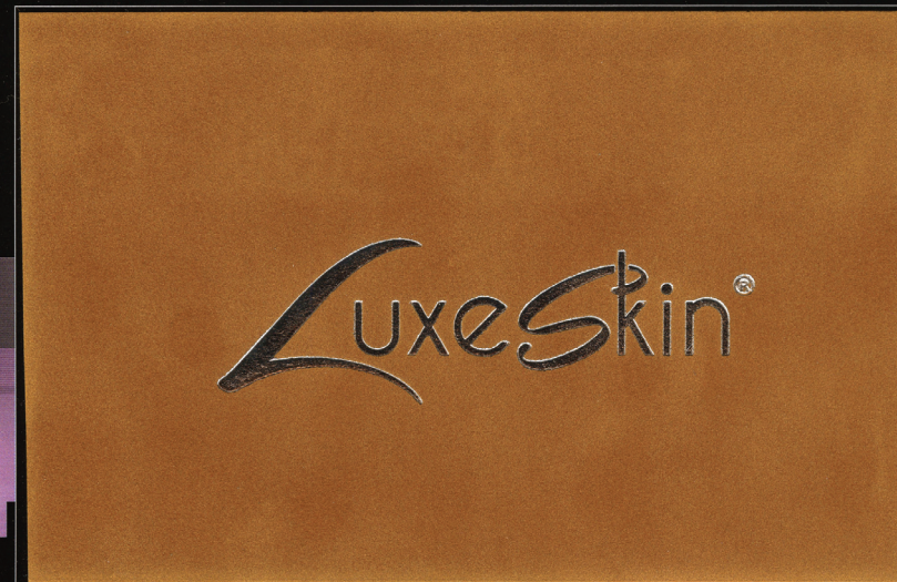
Cuir Lafayette 252