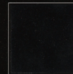
Noir Concorde 262