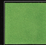
Vert Luxembourg 260