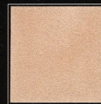
Beige Triomphe 251